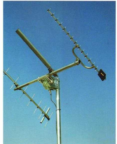
ビームアンテナの据付例